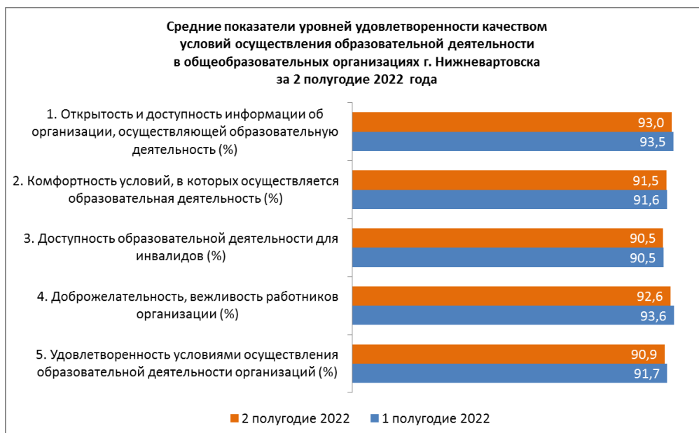
Рисунок 2. Средние показатели уровней удовлетворенности качеством условий осуществления образовательной деятельности в общеобразовательных организациях г. Нижневартовска