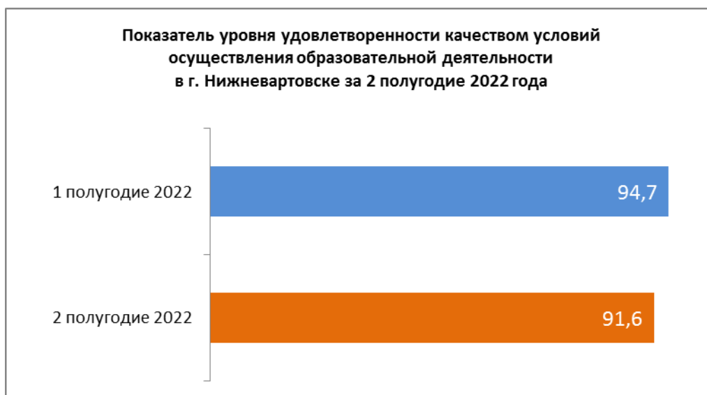
Рисунок 7. Динамика изменения показателей удовлетворенности качеством условий осуществления образовательной деятельности в образовательных организациях г. Нижневартовска

На рисунке 7 представлена динамика изменения показателя уровня удовлетворенности качеством условий осуществления образовательной деятельности в г. Нижневартовске за 2 полугодие 2022 года.