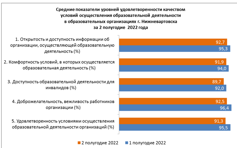
Рисунок 5. Динамика изменения средних показателей по уровням удовлетворенности качеством условий осуществления образовательной деятельности в образовательных организациях города Нижневартовска

На рисунке 5 представлена динамика изменения средних показателей по уровням удовлетворенности качеством условий осуществления образовательной деятельности за 2 полугодие 2022 года в образовательных организациях города Нижневартовска.