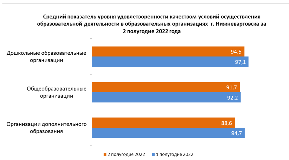
Рисунок 6. Динамика изменения показателей удовлетворенности качеством условий осуществления образовательной деятельности в образовательных организациях г. Нижневартовска

На рисунке 7 представлена динамика изменения показателя уровня удовлетворенности качеством условий осуществления образовательной деятельности в г. Нижневартовске за 2 полугодие 2022 года.