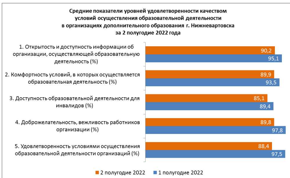
Рисунок 3. Средние показатели уровней удовлетворенности качеством условий осуществления образовательной деятельности в организациях дополнительного образования г. Нижневартовска

На рисунке 4 представлена динамика изменения количества респондентов. Во 2 полугодии 2022 года количество респондентов увеличилось на 627 (4,2%) человек.