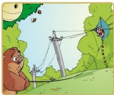
Не бросай ничего на провода и не играй вблизи

Никогда не заходите на территорию и в помещения электросетевых сооружений. Не открывайте двери ограждения электроустановок и не проникайте за ограждения и барьеры. Это может привести к печальным последствиям