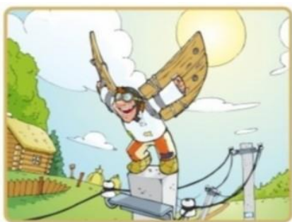
Не лезь на опоры и столбы

Чтобы не подвергать себя риску, запомните простые правила: