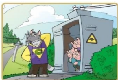
Не лезь на электроустановки и в трансформаторные будки

Опасно для жизни влезать на опоры линий электропередачи, проникать в трансформаторные подстанции или подвалы, где находятся электрические провода